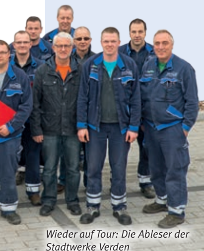
Wieder auf Tour: Die Ableser der Stadtwerke Verden