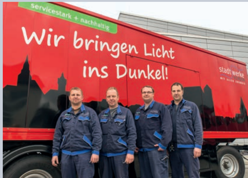
Kein Strom? Mit dem Notstromaggregat helfen die Stadtwerke Verden vor Ort.

+ Sie möchten das Notstromaggregat mieten? Andreas Engfer 04231 915-201