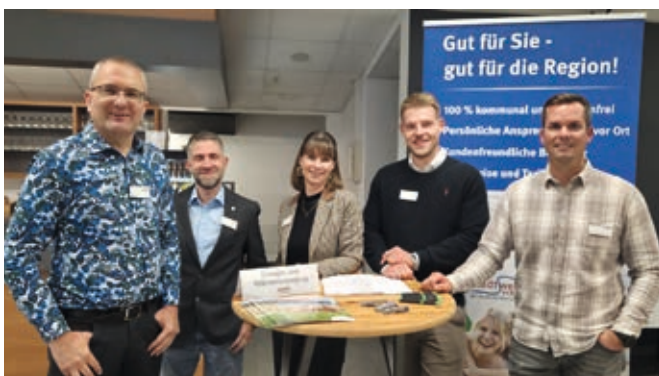
Offen für Fragen: das Team der Stadtwerke Verden.