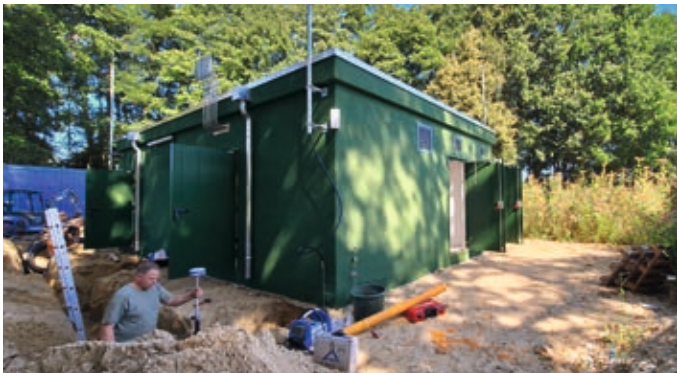
Nach Ende der Bauphase entsteht hier Biogas für Kunden der Stadtwerke Verden.

In Kükenmoor (Kirchlinteln) entsteht eine neue Biogasanlage, die zeitnah in Betrieb gehen und die Stadtwerke Verden mit klimafreundlicherem Gas aus Biomasse wie Pflanzen, Bioabfällen oder Gülle versorgen soll. Es wird die erste Anlage sein, die Biogas in das Erdgasnetz der Stadtwerke Verden einspeisen wird.