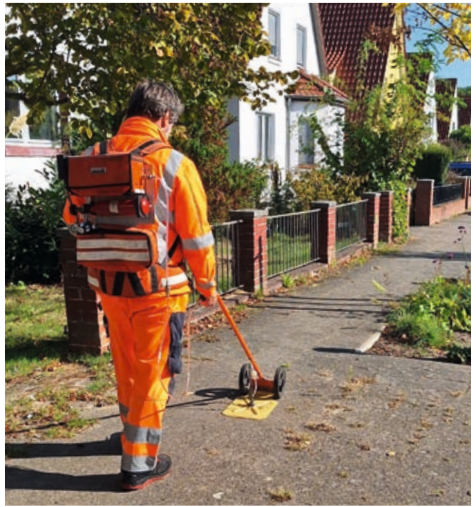
Ein Mitarbeiter der Firma Sewerin untersucht im Auftrag der Stadtwerke Verden das Leitungsnetz.