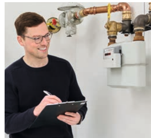
Wir erfassen Ihre Zählerstände ganz genau.

Seit Ende November besuchen die Ableser der Stadtwerke Verden alle Haushalte in unserem Versorgungsgebiet und erfassen die Strom-, Erdgas- und Wasserzählerstände für die Jahresabrechnung. Sollte niemand anzutreffen sein, erhalten Kundinnen und Kunden auf dem Postweg eine Benachrichtigung, in der diese aufgefordert werden, uns die Zählerstände mitzuteilen. Schnell und sicher geht es über das unternehmenseigene Online-Service-Portal auf www.stadtwerke-verden.de . Des Weiteren werden die Daten auch per E-Mail unter abrechnung@stadtwerke-verden.de entgegengenommen. In jedem Fall muss ein Foto, welches Zählernummer und Zählerstand zeigt, beigelegt werden. Liegen uns die Zählerstände nicht bis zum 6. Januar vor, werden die Verbräuche auf Basis der Vorjahreswerte errechnet.