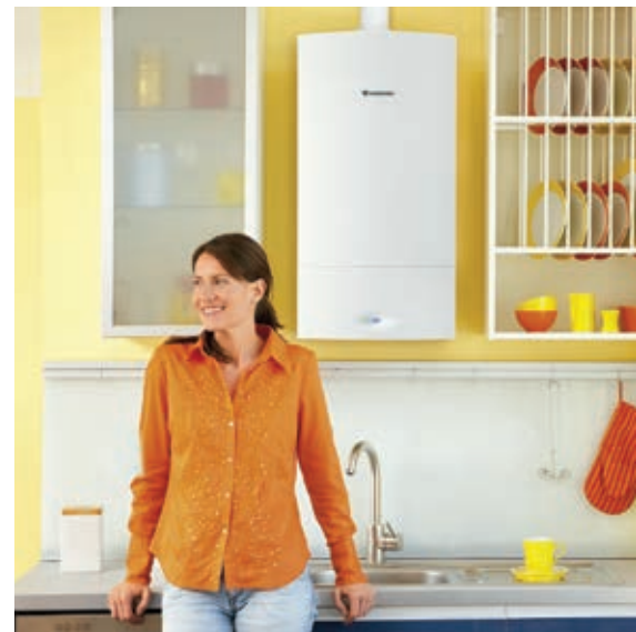
Wandhängende Erdgas-Brennwertgeräte lassen sich aufgrund ihrer kompakten Bauweise sogar in Nischen, zum Beispiel in der Küche oder im Bad, montieren.

wie zum Beispiel Heizöl oder Holzpellets – das schafft Platz für anderes. Auch in der Küche schwören viele Profiköche nach wie vor auf die kleine blaue Flamme, denn beim Kochen und Braten ist die Hitze sofort da und lässt sich stufenlos einstellen.