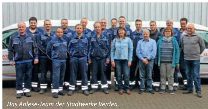
Das Ablese-Team der Stadtwerke Verden.