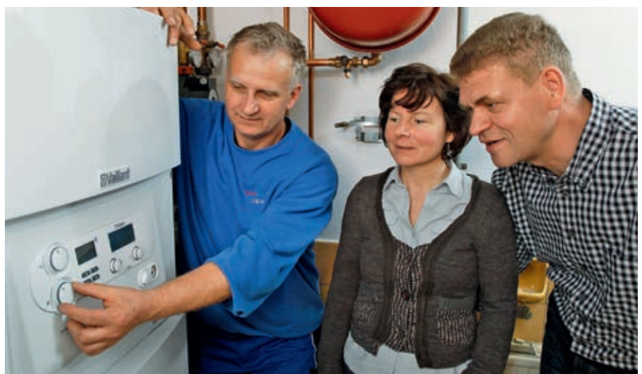
Neue Heizungsanlagen sparen Energie – das kommt der Haushaltskasse und der Umwelt zugute.

Darüber hinaus können sogenannte „Power-to-Gas-Anlagen“ Strom aus regenerativen Quellen – wie Sonne und Wind – in gasförmige erneuerbare Energieträger umwandeln. Das so produzierte, CO 2 -neutrale Gas lässt sich ebenfalls ins öffentliche Transportnetz einspeisen.