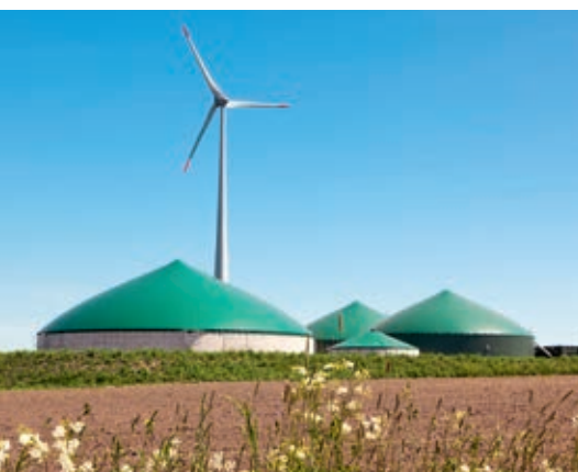
Hier entsteht grüne Energie: Windstrom und Bioerdgas.