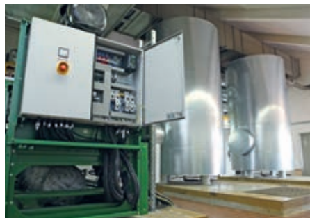
Das BHKW am Verwell erzeugt seit 2017 zuverlässig Wärme und Strom.

Die Stadtwerke Verden können mehr als Strom, Erdgas und Wasser liefern – als verlässlicher Partner mit Energiekompetenz unterstützen sie ihre Kunden auch bei der Planung und Umsetzung energetischer Mo-