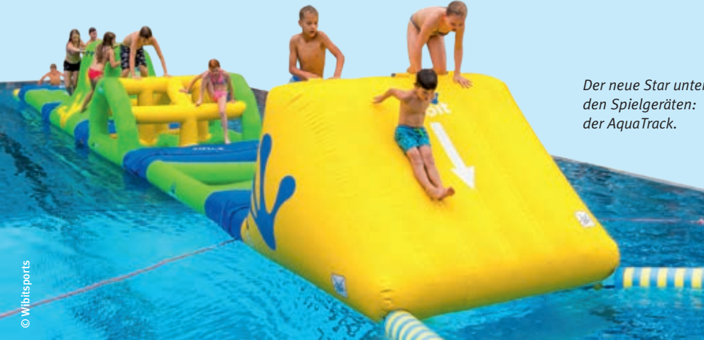
Der neue Star unter den Spielgeräten: der AquaTrack.

Aufsichtspflicht im Babybecken liegt bei den Eltern, das Verwell passt an den anderen Becken auf. Dennoch sollten alle Gäste beachten, dass trotz vorhandener Badeaufsicht grundsätzlich die Erziehungs- und Begleitpersonen die Pflicht zur aktiven Aufsicht haben.