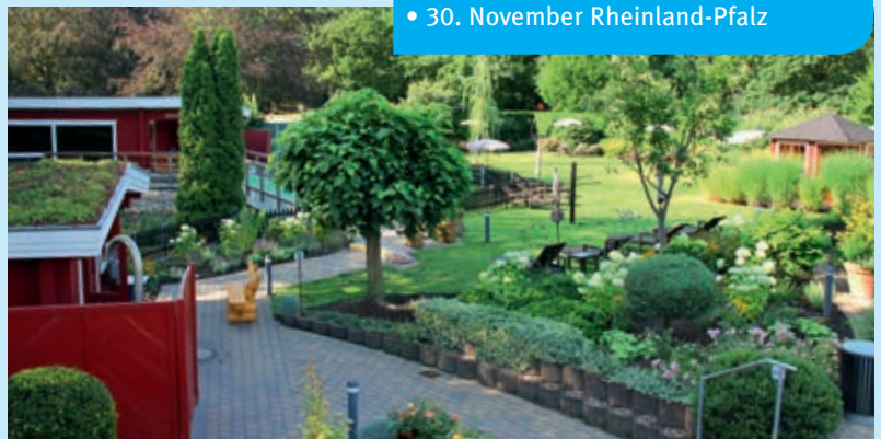
Der Saunagarten des Verwell Erlebnisbads.