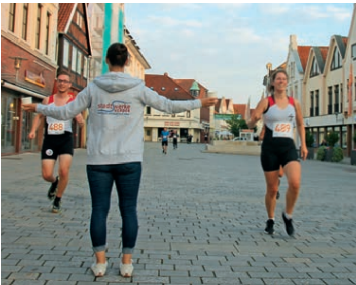
Kühles Nass zum Mitnehmen – dafür sorgten die Stadtwerke Verden vor dem Rathaus.