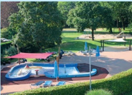
Der Spielplatz ist nun in der Nähe des Babybeckens.