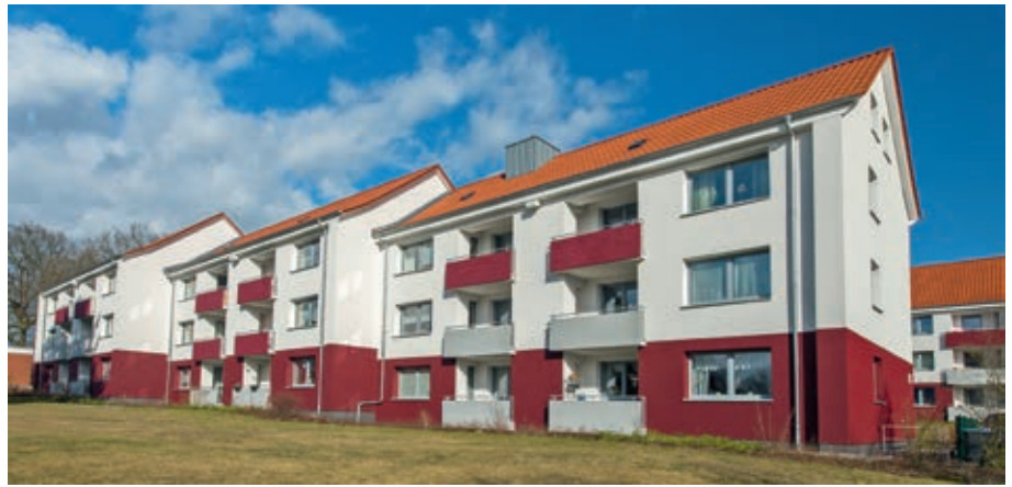
Umweltschonende Nahwärme für die Wohnblöcke im Fuhrenkamp: Für die Kreisbaugesellschaft Verden betreiben die Stadtwerke ein BHKW sowie einen Spitzenlastkessel.

Ein Vorteil von VerContracting: Der Kunde muss keine eigenen Anschaffungs- und Installationskosten tragen, sondern zahlt während der Vertragslaufzeit einen monatlichen Betrag, in dem auch sämtliche Reparaturen, regelmäßige Wartungen sowie Schornstein-