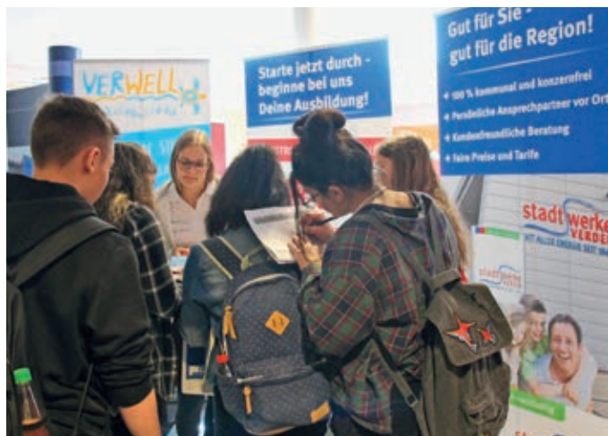
Bei der Ausbildungsbörse im Mai herrschte reges Interesse am Stadtwerke-Stand.