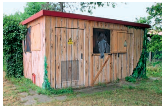
Schon seit mehreren Jahren ein Hingucker: die bemalte Trafostation der Stadtwerke Verden in der Lindhooper Straße.