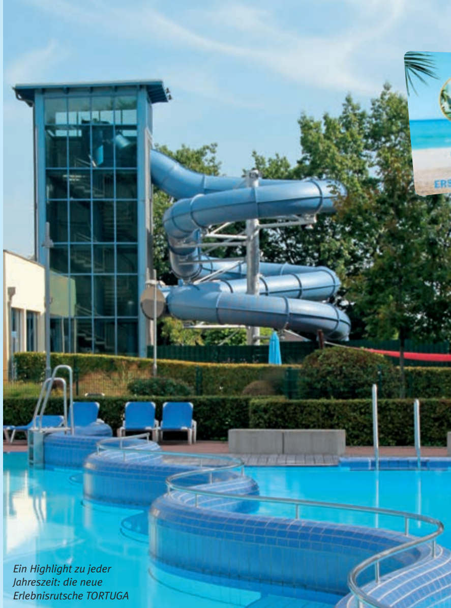
Ein Highlight zu jeder Jahreszeit: die neue Erlebnisrutsche TORTUGA

Während die Saunawelt zum Aufwärmen und Entspannen einlädt, können badebegeisterte Besucher im überdachten Sport- und Erlebnisbecken ihre Bahnen ziehen. Wer es rasanter mag, sollte unbedingt die neue Erlebnisrutsche TORTUGA ausprobieren. Da sich Zugang und Landebecken im Innenbereich befinden, kann man sie auch im Winter problemlos hinabdüsen. „Die Rutsche kommt super an“, freut sich der stellvertretende