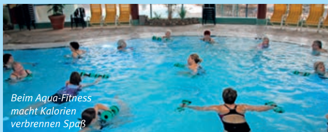
Beim Aqua-Fitness macht Kalorien verbrennen Spaß

Der Zutritt zu den Saunen ist derzeit auf maximal sieben Personen begrenzt, in der Teichsauna dürfen 14 Gäste Platz nehmen.