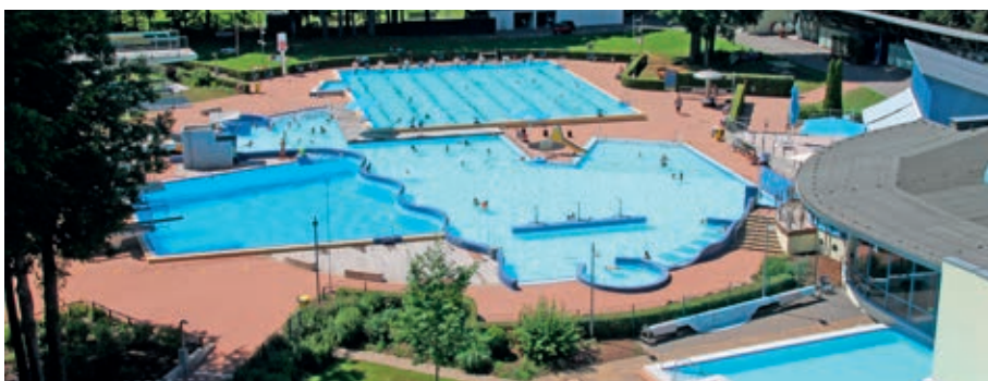
Umweltschonender Publikumsmagnet: das Verwell Erlebnisbad.