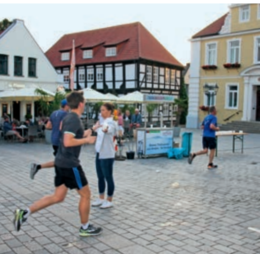
Beim Verdener Stadtlauf unterstützen wir die Sportler mit frischem Trinkwasser.

tig“, betont Weiland. Nachhaltigkeit spielt dabei eine große Rolle: vom Ausbau der regenerativen Energieerzeugung über das Vorantreiben der örtlichen Ladeinfrastruktur für Elektrofahrzeuge bis hin zum Artenschutz. So machen wir uns stark für eine attraktive Region.