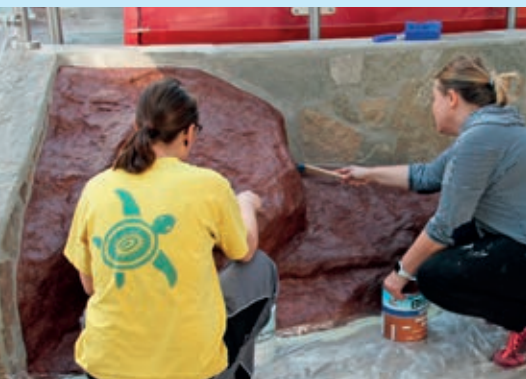
Mit vereinten Kräften bringt das Verwell-Team alles zum Strahlen.

Für das Verwell gibt er jedoch Entwarnung: „Wir halten trotz wirtschaftlicher Einbußen durch!“