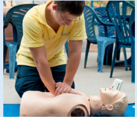
Lebensretter beim Training: Bei der Herz-Lungen-Wiederbelebung muss jeder Handgriff sitzen.