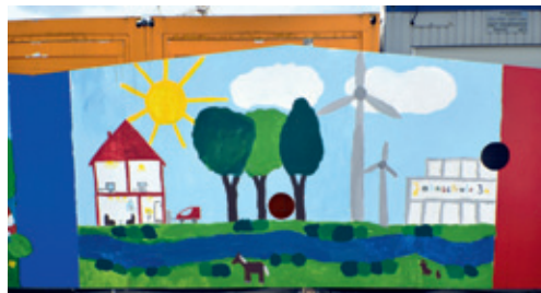
Platz 1 unter den Werken der Erst- bis Viertklässler