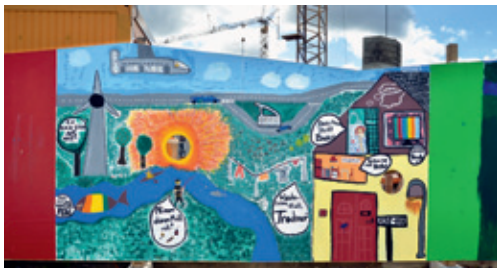
Gewinnerbild der Jahrgangsstufen 5 bis 9

bereits das Vorzertifikat in Silber der Deutschen Gesellschaft für Nachhaltiges Bauen bekommen.“ Das Zertifikat bescheinigt eine besonders umweltschonende Bauweise und einen geringen Energieverbrauch.